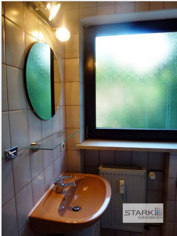
Badezimmer mit Fenster und Duschkabine