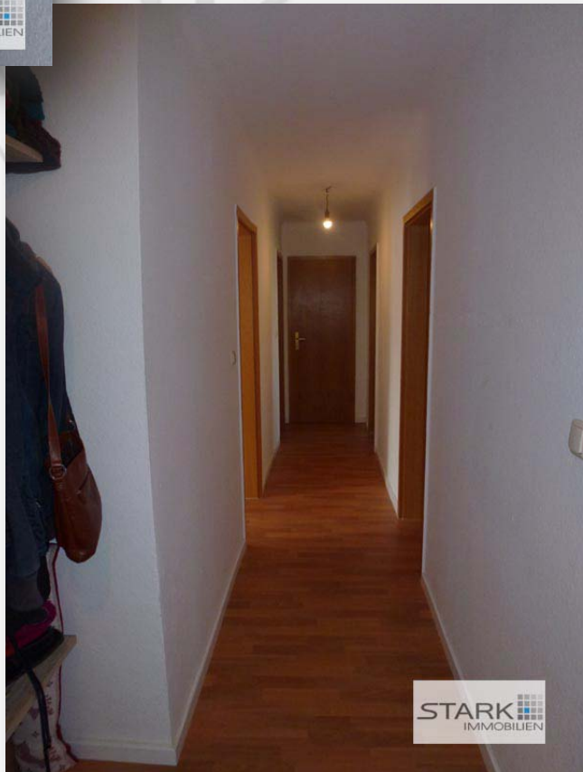
Diele, mit Platz für Garderobe