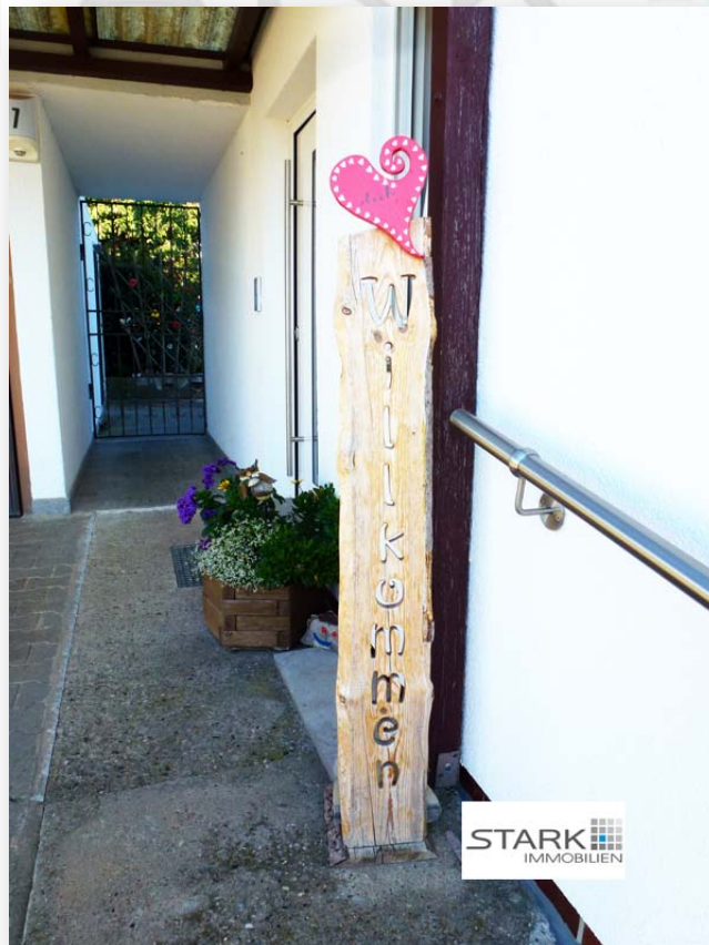
Eingangsbereich vor dem Haus - Herzlich Willkommen!