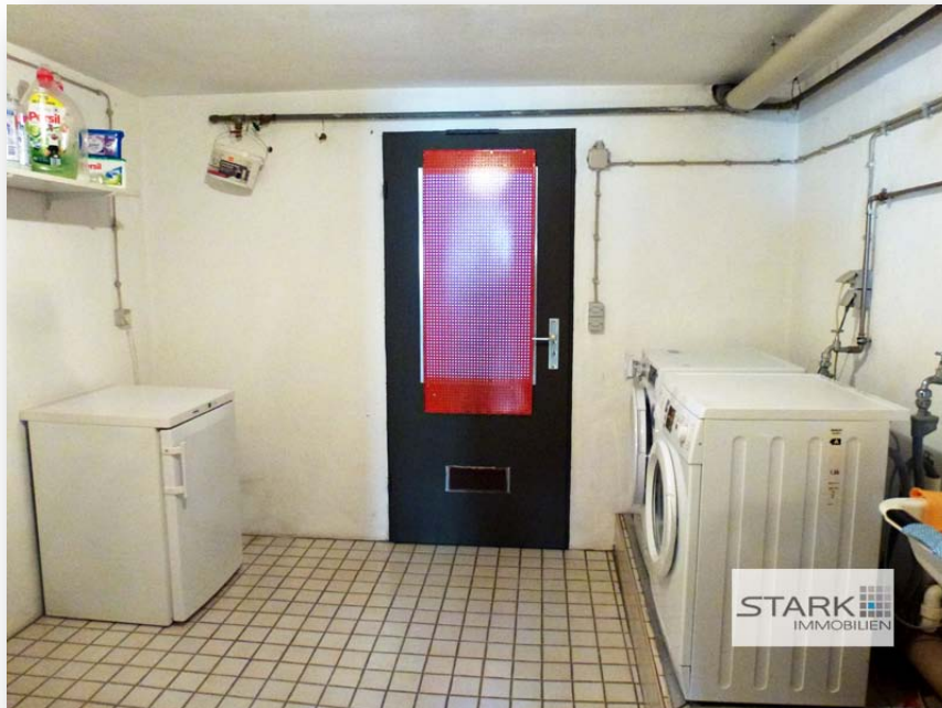
Gemeinschaftliche Waschküche - ein eigener Kellerraum sorgt außerdem für Stauraum!