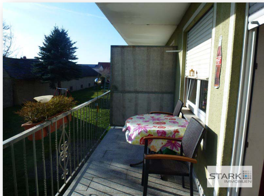
Ihr Balkon - Blick in den Garten