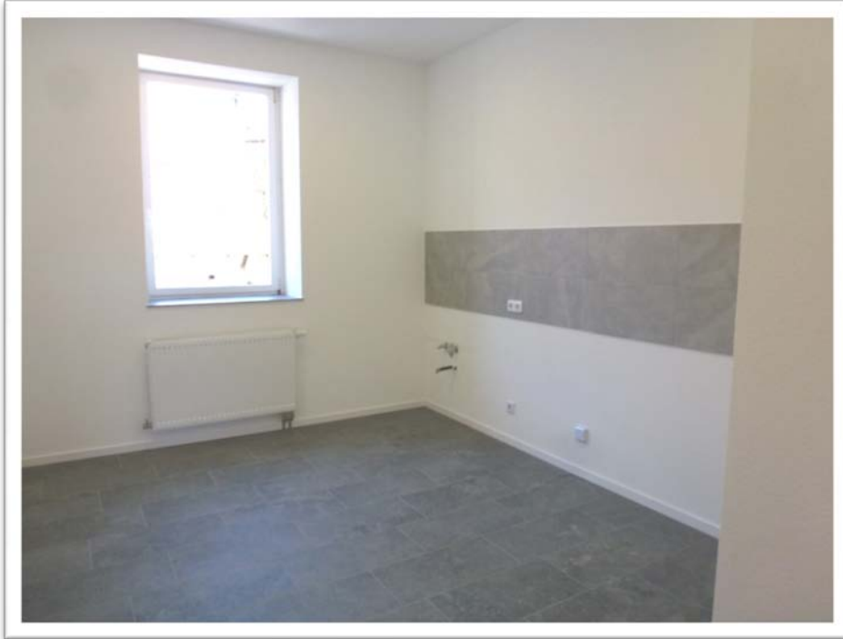
Die geräumige Küche