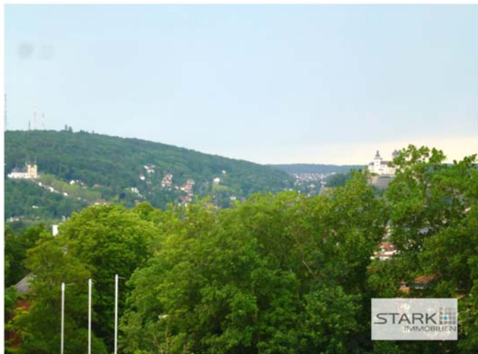
... so lässt sich der Sommer in der Stadt aushalten!