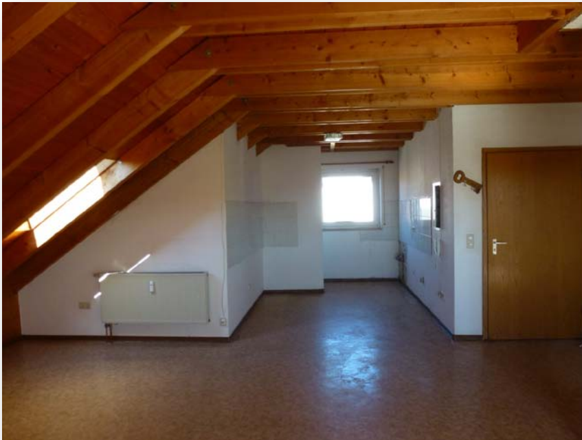
Küchenbereich zum Wohnzimmer