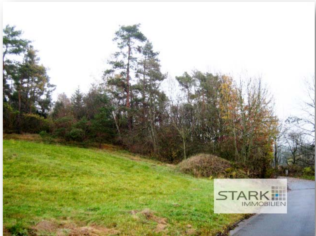
Ansicht von der Straße aus